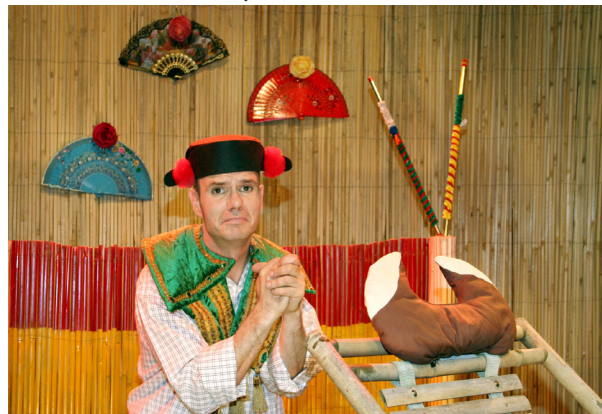
Die Geschichte eines Außenseiters, der ungewollt und ganz friedlich zum Helden wird Stückdauer ca. 50 Minuten, für Menschen ab 4 Jahre