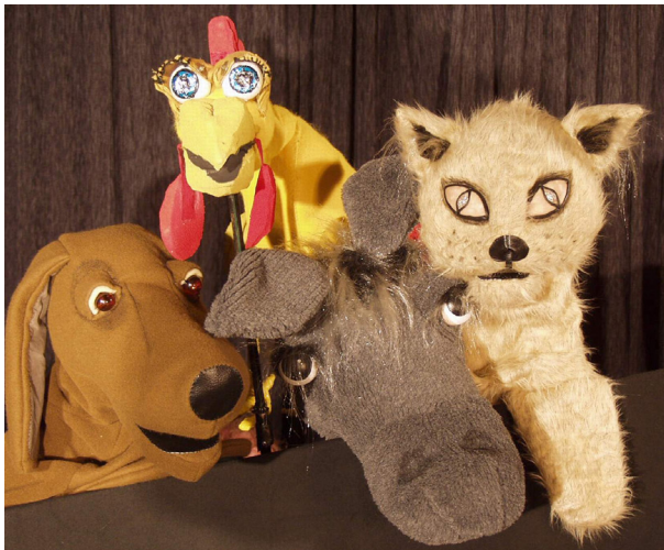
Ein altes Märchen in einer heiteren Kombination aus Theater und großen ausdrucksstarken Spielfiguren Stückdauer ca. 50 Minuten, für Menschen ab 4 Jahre