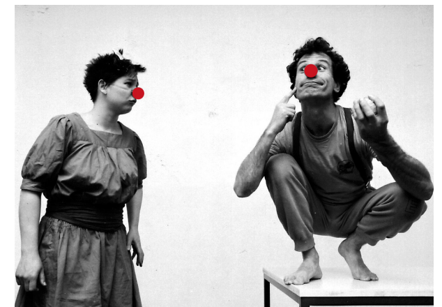
Hier wird auf spielerische Art und Weise ein altes Märchen neu entdeckt Stückdauer ca. 60 Minuten, für Menschen ab 4-5 Jahre

Die Clowns verlassen immer wieder die Vorlage des Märchens, sie erleben die Konflikte, die im Froschkönig erzählt werden - das Märchen wird für sie lebendiges Spiel!