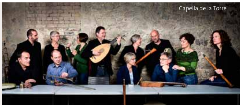
Capella de la Torre

Igel, Ente, Hase und Bär machen sich auf, die Musikinstrumente zu entdecken und finden dabei auch heraus, wie „so ein schöner Schall“ entsteht. Besonders schön ist es, wenn am Ende alle als Stadtmusikanten zusammen Musik machen. Das Konzert richtet sich an Kinder von 5 bis 15 Jahren und erzählt die Geschichte, die Entstehung und