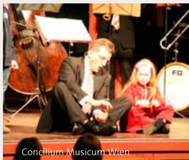
Concilium Musicum Wien

Eine kleine Melodie geht mit Sängern und Instrumentalisten des Concilium musicum Wien auf Reisen. Dabei erlebt sie eine ganze Menge. Mal ist sie sehr schnell unterwegs und mal ganz langsam, mal hüpfert sie hoch hinauf und dann wieder ganz tief hinunter. Die Vögel zwitschern und Pferdegetrappel ist zu hören. Die kleine Melodie trifft unterwegs auch andere Melodien. Mit einigen tanzt sie gemeinsam und verwandelt sich dabei ganz plötzlich in einen Marsch, in einen Walzer, in eine Polka. Andere Melodien erzählen von ihren Erlebnissen z. B. von Handwerkern und dem Postillon. Ganz nebenbei werden den Kindern dabei Takt, Rhythmus, Tonhöhen und die verschiedenen Instrumente erklärt. Am Ende findet die kleine Melodie sogar neue Freunde, wenn die Kinder anfangen, mit Hilfe der lebendigen Tonleiter neue, eigene Melodien zu erfinden.