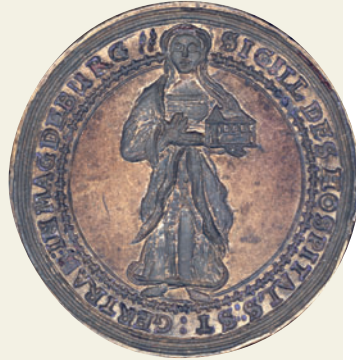
Siegel des Hospitals St. Georgii und des Hospitals St. Gertraud, o. J.