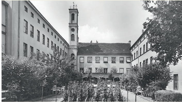
Innenhof des Hospitals St. Georgii, Stiftstraße 1, 1927