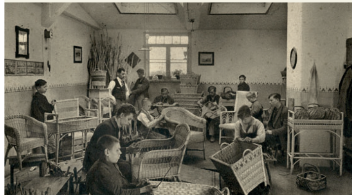
Lehrwerkstätten Korbmacherei der Pfeifferschen Stiftungen, Postkarte um 1930

14:00 UHR Die Magdeburger Stiftungen in der ersten Hälfte des 20. Jahrhunderts (1914 bis 1945) Dr. Lutz Miehe (Magdeburg)