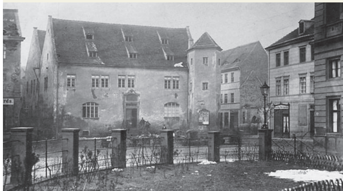
Reformiertes Waisenhaus, Johannisberg/Gr. Junkerstraße, 1927 © Stadtarchiv Magdeburg, Fotobestand Hochbauamt 3358