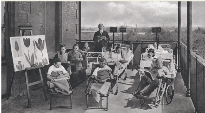
Unterricht im Freien, Postkarte um 1920

Interessierte Mitstreiter und alle Freunde der Stadtgeschichte sind herzlich eingeladen.