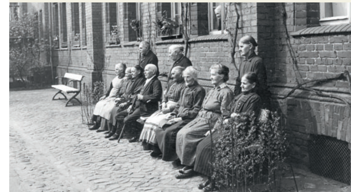
Bewohner im Hof des Klosters St. Augustini, Neustädter Straße 2, 1930