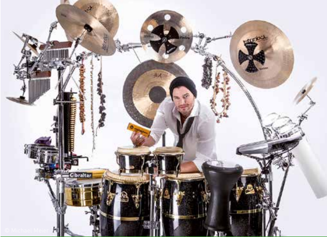
MUSIK IM SOMMER

Mi, 14. August / 19.00 Uhr / Platz der Kulturen