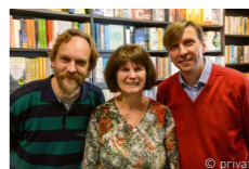
Team Literarischer Spaziergang