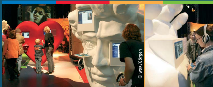
Von Kopf bis Fuß: Eine spannende Zeitreise für Klein und Groß

Sie stehen für die Themenbereiche Integration und Bildung, Lebensart, Arbeit und Kreativität sowie Tourismus und Auswanderung. Die überdimensionalen Körperteile sind zugleich Multimediasäulen, die mit wahren Schätzen aus den WDR-Archiven bestückt sind. Mit einem Kopfhörer auf den Ohren können sich die Besucher per Computermaus durch abwechslungsreiche Beiträge aus Radio, Fernsehen und Internet klicken und so verschiedene Geschichten italienischen Lebens in Deutschland und deutscher Italienliebe genießen. Gualtiero Zambonini: »Die Italiener stießen damals auf viele Vorurteile. Heute sind sie sehr beliebt. Diese positive Entwicklung vom Gastarbeiter zum Bürger wollen wir mit dieser Ausstellung dokumentieren.«