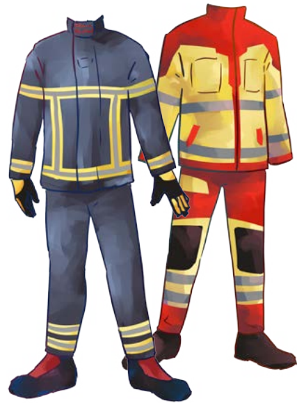
Einsatzkleidung Feuerwehr und Rettungsdienst