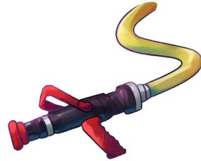
Strahlrohr mit Schlauch