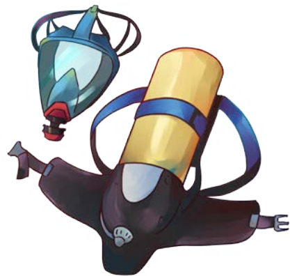
Atenschutzgerät mit Maske